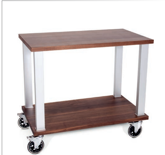
Servierwagen 100% Walnuss Hartholz galvanisierte Aluminiumfüße, spiegellglänzend 4 bewegliche Lenkrollen aus antistatischem Gummi mit Bremsen Durchmesser 125 mm sehr leise 93x53 cm h 80 cm • Art. 123210