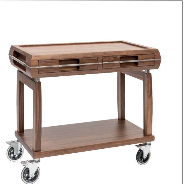
Servierwagen 100% Walnuss Hartholz 2 ausziehbare Schubladen 4 bewegliche Lenkrollen aus antistatischem Gummi mit Bremsen Durchmesser 125 mm sehr leise 99.5x54 cm h 82 cm Art. 123212