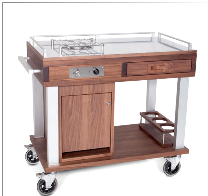
Servierwagen Flambee 100% Walnuss Hartholz Arbeitsfläche in rostfreiem Edelstahl 18/10 ausziehbare Schublade galvanisierte Aluminiumfüße, spiegellglänzend 4 bewegliche Lenkrollen aus antistatischem Gummi mit Bremsen Durchmesser 125 mm, sehr leise Gasbrenner, Flaschenhalterung und Brenner mit CE-Zertifizierung; 1.5 kw 99.5x53 cm h 85 cm • Art. 123207