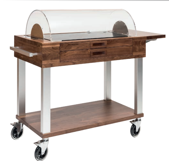
Servierwagen gekühlt Dessert und Käse 100% Walnuss Hartholz 2 ausziehbare Schubladen, eine mit Kühlelement galvanisierte Aluminiumfüße, spiegellglänzend 4 bewegliche Lenkrollen aus antistatischem Gummi mit Bremsen Durchmesser 125 mm, sehr leise aufklappbare Ablage 23x53 cm Steinschneidebrett (Serpentin) 38x75 cm Rolltophaube komplett abnehmbar 105.5x52.5 cm h 109 cm • Art. 123211