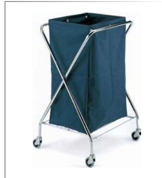
Wäschewagen DUST Edelstahl verchromt

Lenkrollen ø 80 mm mit Fadenschutz mit Wäschesack 180 l 62x60 cm h 92 cm