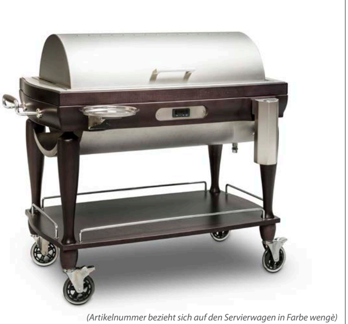
(Artikelnummer bezieht sich auf den Servierwagen in Farbe wengé)

Servierwagen für Gekochtes versenkbare Gloche in glänzendem rostfreiem Edelstahl 230 Volt, 1400 kw Bain Marie elektrisch mit Thermostat regulierbar - max. Temperatur 80°C 1 Wanne GN1/1 und 1 Wanne GN1/2 Wasserfassungsvermögen ca. 10 l Messerbehälter und Tellerhalterung 117x60 cm h 112 cm • Art. 123215 Farbe wengé