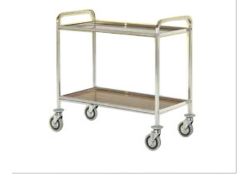
Servierwagen 2 Ablagen Holz/Edelstahl rostfrei 18/10 Rahmen aus rostfreiem Stahlrohr 18/10 Quadratrohr 20x20 mm Ablagen mit säurebeständiger Laminatbeschichtung Farbe Nussbaum 4 graue Gummirollen ø 125 mm, ohne Bremsen Gummipuffer 51x95 cm h 90 cm Art. 29511