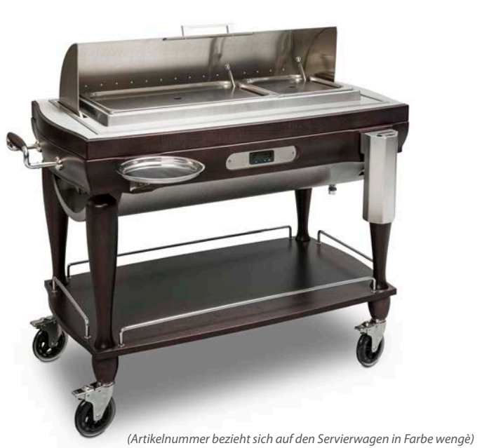
(Artikelnummer bezieht sich auf den Servierwagen in Farbe wengé)

Servierwagen für Gekochtes versenkbare Gloche in glänzendem rostfreiem Edelstahl 230 Volt, 1400 kw Bain Marie elektrisch mit Thermostat regulierbar - max. Temperatur 80°C 1 Wanne GN1/1 und 1 Wanne GN1/2 Wasserfassungsvermögen ca. 10 l Messerbehälter und Tellerhalterung 117x60 cm h 112 cm • Art. 123215 Farbe wengé