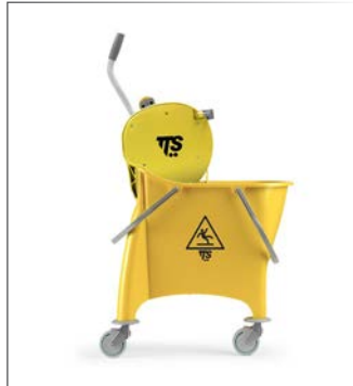
Reinigungswagen WITTY Polypropylen, gelb rostfrei und langlebig Fahrer mit Abfluss abnehmbare Wassertrennwand (trennt Spülwasser von Reinigungslösung) Dry Rollenpresse ø 80 mm Lenkrollen mit Stoßfangscheiben 67x39 cm h 98 cm, 8 kg Art. 104787