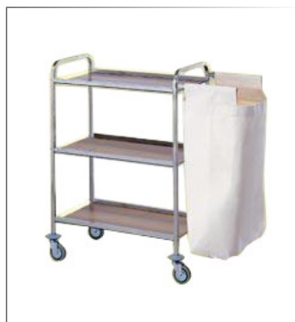
Stockwagen 3 Ablagen Holz, nuss Rahmen aus rostfreiem Stahl 18/10 AISI 304 Quadratrohr 20x20 mm Ablagen aus Laminatplastik 1 Wäschesack aus Stoff 4 Gummirollen ø 125 mm, Gummipuffer 40x80 cm h 104 cm Art. 29515