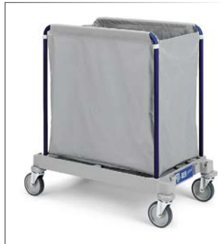
Wäschewagen GREEN HOTEL 915 Kunststoff/Edelstahl rostfrei 18/10 Kleines Grundgestell mit ø 125 mm Rädern 2 Holme für Green Hotel Wäschewagen Kunststoffsack 200l 53x88x91 cm Art. 106662