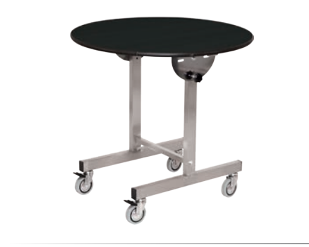
Gueridon rund verchromtes Stahlrohr, schwarz klappbar ø 80 cm h 80 cm Art. 123043