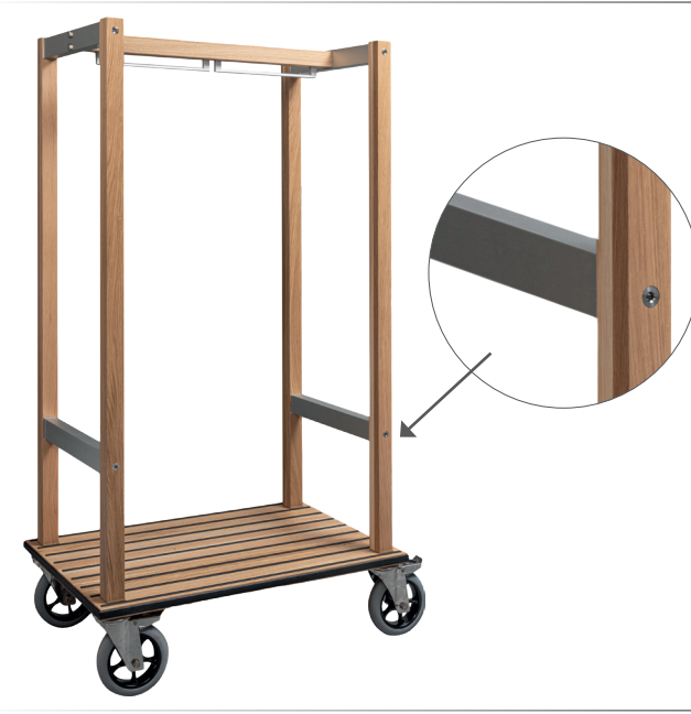
Kofferwagen mit Kleiderbügel Holz/Aluminium Eiche 4 gelenkige Räder mit Bremsen ø 200 mm Eichenholz mit transparentem Schutzlack Ablage mit Kantenschutzumrundet und mit Antirutschstreifen Lichtmaß zwischen Stangen 82x44 cm mit Kleiderbügelhalter