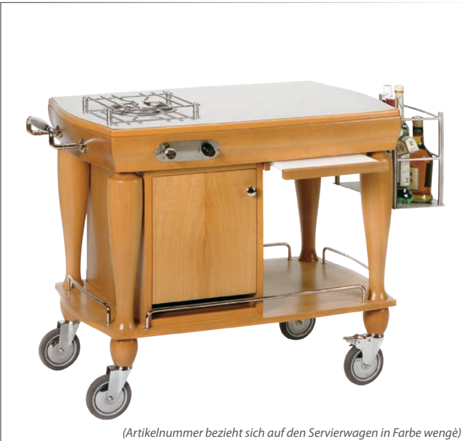
(Artikelnummer bezieht sich auf den Servierwagen in Farbe wengé)

Servierwagen für Rinderbrust versenkbare Gloche in glänzendem rostfreiem Edelstahl 230 Volt, 1400 kw Bain Marie elektrisch mit Thermostat regulierbar - max. Temperatur 80° 1 Wanne GN1/1 und 2 Wanne GN1/4 - Wasserfassungsvermögen ca. 10 l Schneidbrett in Polyethylen 53x32,5 cm Messerbehälter und Tellerhalterung 117x60 cm h 112 cm • Art. 123216 Farbe wengé