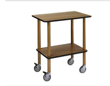
Gueridon 2 Ablagen Holz, nuß Massivholzrahmen aus abgelagerter Buche Ablagen aus Holz mit Laminatverkleidung Nuss-Farbe 4 graue Gummirollen ø 100 mm, ohne Bremsen 45x70 cm h 80 cm Art. 29502