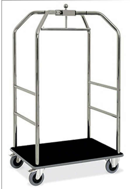
Kofferwagen mit Kleiderbügel verchromtes Stahlrohr chrom/schwarz 2 Fixräder, 2 gelenkige Räder mit Bremse 59x98 cm h 190 cm Art. 29182