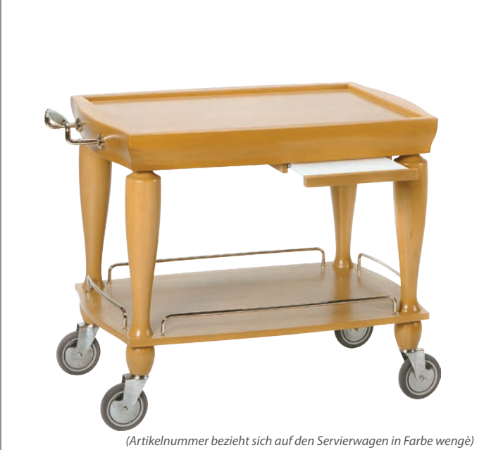
(Artikelnummer bezieht sich auf den Servierwagen in Farbe wengé)

aus hochwertigem Mehrschichtholz, in verschiedenen Farben erhältlich - Metallteile in rostfreiem Edelstahl 18/10, spiegelglänzend 4 bewegliche Lenkrollen aus antistatischem Gummi, 2 mit Bremsen, Durchmesser 125 mm, sehr leise Beschläge aus Massivholz mit Einsätzen in Edelstahl