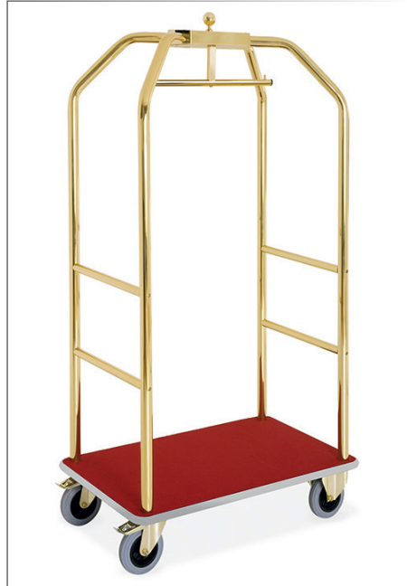
Kofferwagen mit Kleiderbügel verchromtes Stahlrohr messing/bordeaux 2 Fixräder, 2 gelenkige Räder mit Bremse 59x98 cm h 190 cm Art. 29181