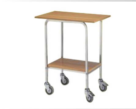
Gueridon 2 Ablagen Holz/Edelstahl rostfrei 18/10 Rahmen aus 18/10 rostfreiem Stahlrohr Quadratrohr 20x20 mm Ablagen aus Holz mit Laminatverkleidung Nuss-Farbe 4 graue Gummirollen ø 100 mm, ohne Bremsen 45x70 cm h 90 cm Art. 29501