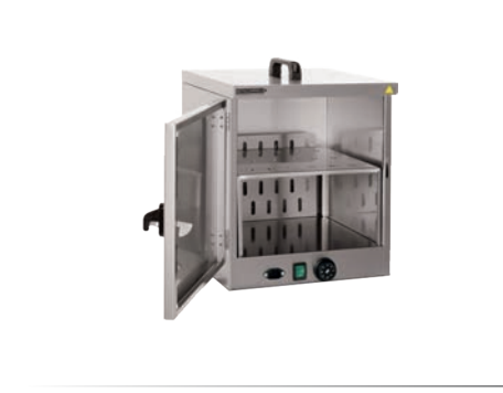
Warmhalteschrank thermisch für Gueridon rostfreier Edelstahl 18/10, für Art. 123043 45x46 cm h 51 cm • Art. 125452