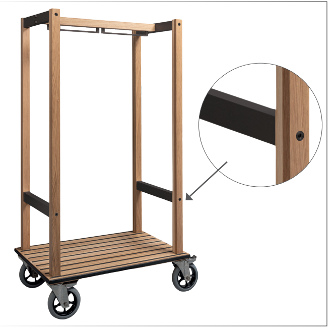
Kofferwagen mit Kleiderbügel Holz/Aluminium Eiche/schwarz 4 gelenkige Räder mit Bremsen ø 200 mm Eichenholz mit transparentem Schutzlack Ablage mit Kantenschutzumrundet und mit Antirutschstreifen Lichtmaß zwischen Stangen 82x44 cm mit Kleiderbügelhalter 60x98 cm h 190 cm Art. 125406