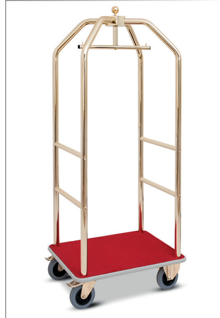
Kofferwagen mit Kleiderbügel verchromtes Stahlrohr messing/bordeaux 2 Fixräder, 2 gelenkige Räder mit Bremse 59x79 cm h 190 cm • Art. 29183