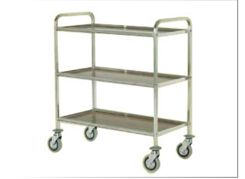
Servierwagen 3 Ablagen Holz/Edelstahl rostfrei 18/10 Rahmen aus rostfreiem Stahlrohr 18/10 Quadratrohr 20x20 mm Ablagen mit säurebeständiger Laminatbeschichtung Farbe Nussbaum 4 graue Gummirollen ø 125 mm, ohne Bremsen Gummipuffer 52x95 cm h 90 cm Art. 29514

Weitere Servierwagen finden Sie im GV-Bereich