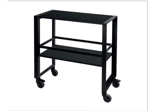
Gueridon 2 Ablagen INDUSTRIAL Stahl pulverbeschichtet/Laminat, schwarz 4 gelenkige Räder/mit Bremsen Rahmen aus gekantetem Stahl mit 3 mm Stärke Veredeltes Laminat mit 18 mm Dicke Reifen mit einem Durchmesser von 125 mm maximale Tragfähigkeit: 400 kg 35x70 cm h 73 cm Art. 132663