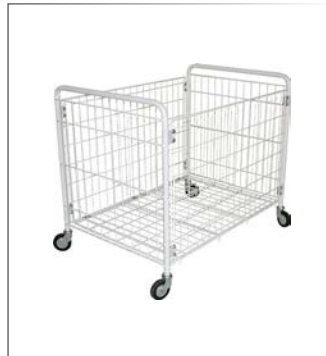
Wäschewagen plastifizierter Stahl weiß klappbar