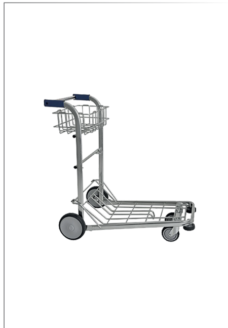
Kofferwagen mit Ablage verchromtes Stahlrohr inox 2 Fixräder, 2 gelenkige Räder 97x60 cm h 102 cm Art. 119783