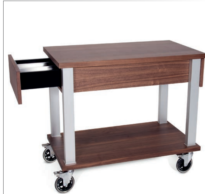
Servierwagen 100% Walnuss Hartholz 2 ausziehbare seitliche Schubladen mit je 3 Abteilungen galvanisierte Aluminiumfüße, spiegellglänzend 4 bewegliche Lenkrollen aus antistatischem Gummi mit Bremsen Durchmesser 125 mm sehr leise 93x53 cm h 80 cm Art. 123209