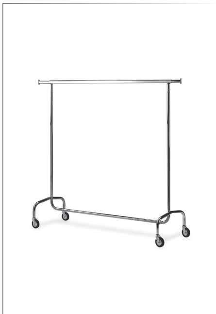
Transportwagen für Garderobe verchromtes Stahlrohr inox 60 cm ausziehbare Stange 210x53 cm h 152 cm Art. 29330