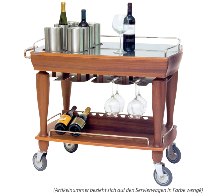
(Artikelnummer bezieht sich auf den Servierwagen in Farbe wengé)

Servierwagen Digestiv und Likör Arbeitsfläche in rostfreiem Edelstahl 18/10 6 Flaschenkühler in rostfreiem Edelstahl 18/10 Beschläge aus Massivholz mit Einsätzen in Edelstahl mit Glashalterung Flaschenablagefläche auf unterer Ablage 102x60 cm h 85 cm