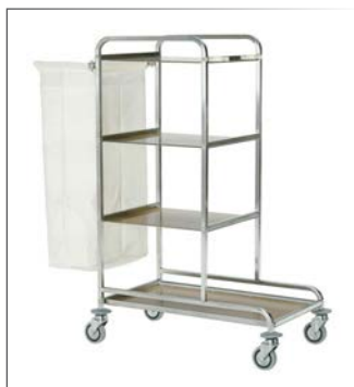
Stockwagen 4 Ablagen Holz, nuss Rahmen aus rostfreiem Stahl 18/10 AISI 304 Quadratrohr 20x20 mm Ablagen aus Laminatplastik, 1 Wäschesack aus Stoff 4 Gummirollen ø 125 mm, Gummipuffer 90x53 cm h 134 cm Art. 29516